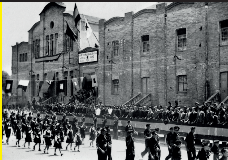
Desfilada de la Falange Española Tradicionalista y de las Jons a Mollet del Vallès, anys 40.